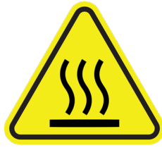
Gevaar voor heet oppervlak