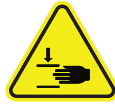
Gevaar voor kneuzingen