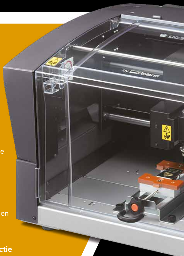
Afgebeeld model met optionele zelf centrerende klemtafel

Dankzij de mogelijkheden voor machinebeheer op afstand biedt de DE-3 USB- en LAN-netwerkconnectiviteit voor het graveren met meerdere machines. Verhoog uw productie met de DE-3.